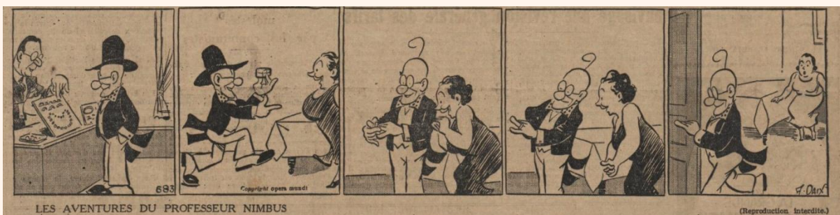
Les aventures du professeur Nimbus : Le journal 24 décembre 1936